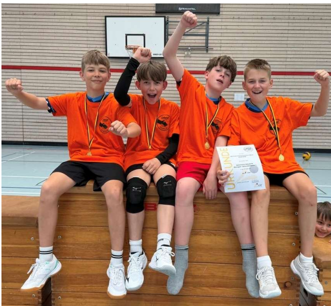
U13 männlich Bezirksmeister und Teilnahme an Württembergischer Meisterschaft