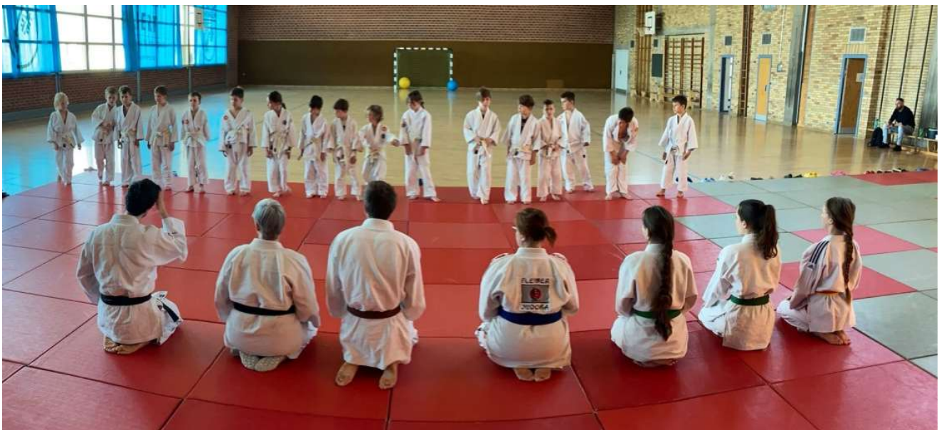
Gürtelprüfungsvorbereitungstraining (April 2025)

Dieser fehlende Mut und die Bereitschaft an Wettkämpfen teilzunehmen ist ein ernstzunehmendes Problem, dem wir (der Verein) wie auch der Judoverband entgegensteuern muss, um zukünftig neue Weltmeister und Olympiasieger zu haben.