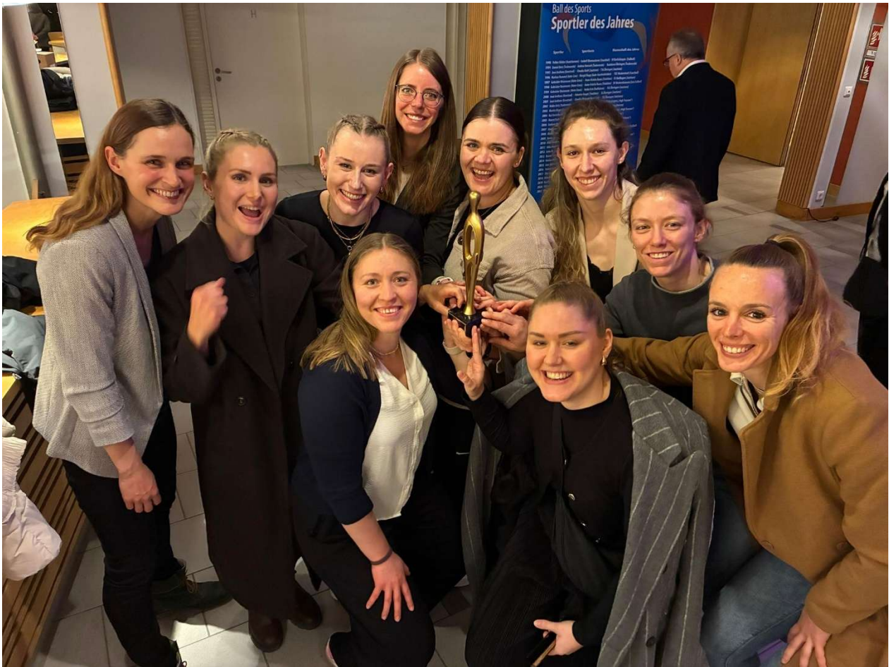
Damen 1 Verbandsliga Mannschaft des Jahres 2025 Sportkreis Hohenlohe