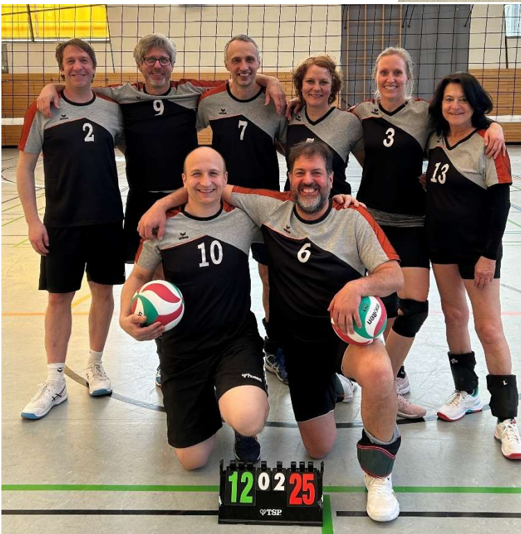
Mixed Meister C-Klasse