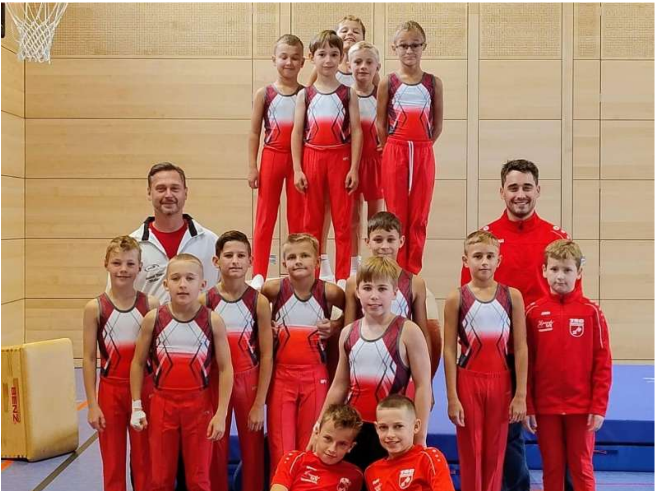
Gaufinale Mannschaft 2025