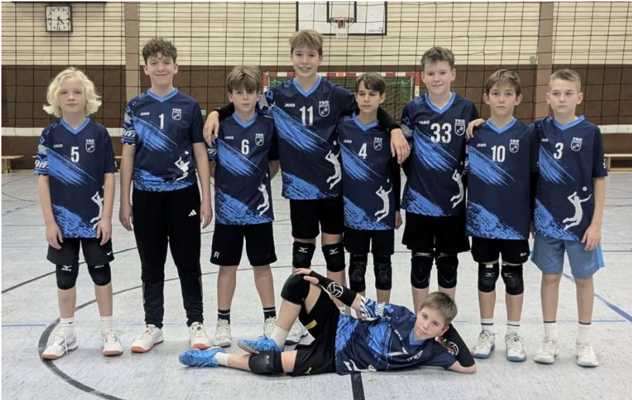
U15 männlich Mannschaft 1 und 2