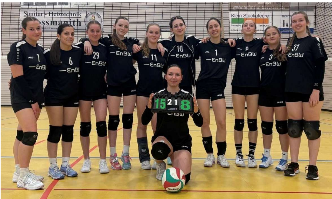
U17 weiblich Mannschaft 1 Teilnehmer Württembergische Meisterschaft und Mannschaft 2