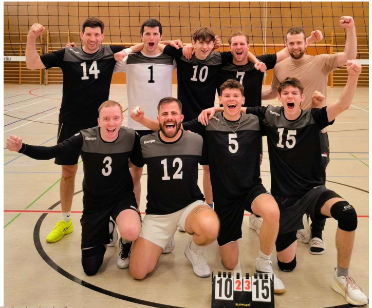
Herren 1-Meister Landesliga und Bezirkspokalsieger