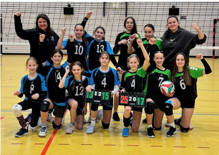
U15 weiblich Mannschaft 1 und 2