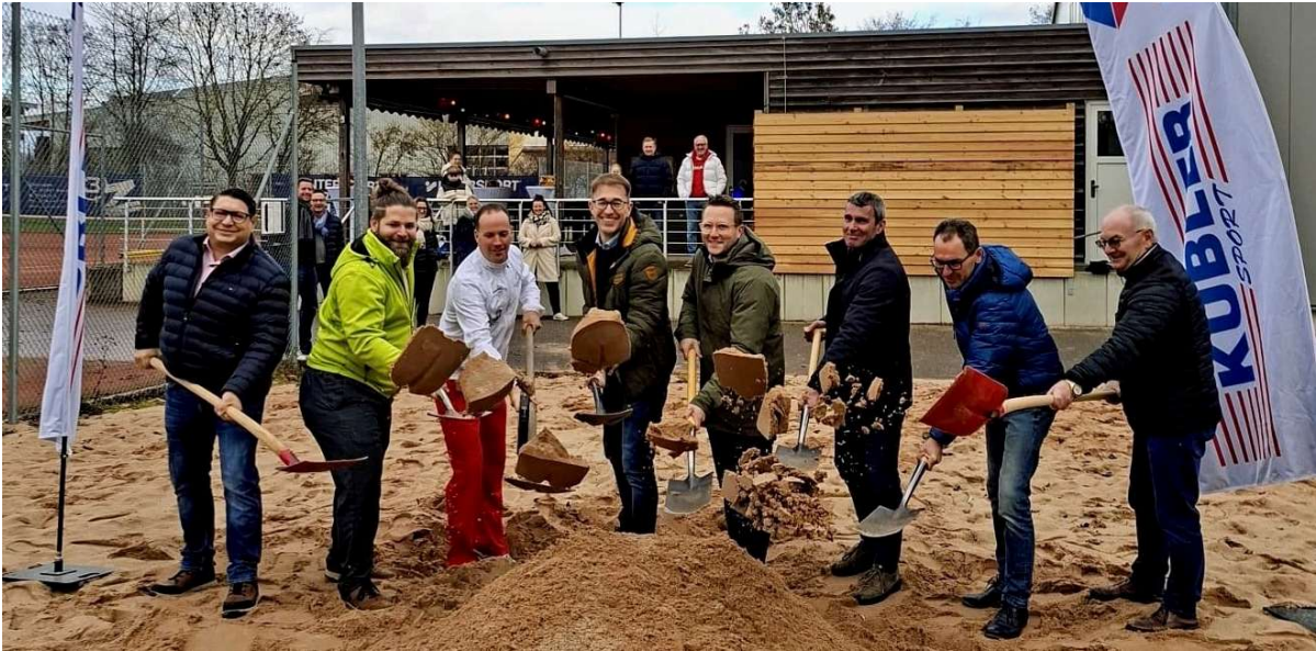
Spatenstich der Padel-Anlage