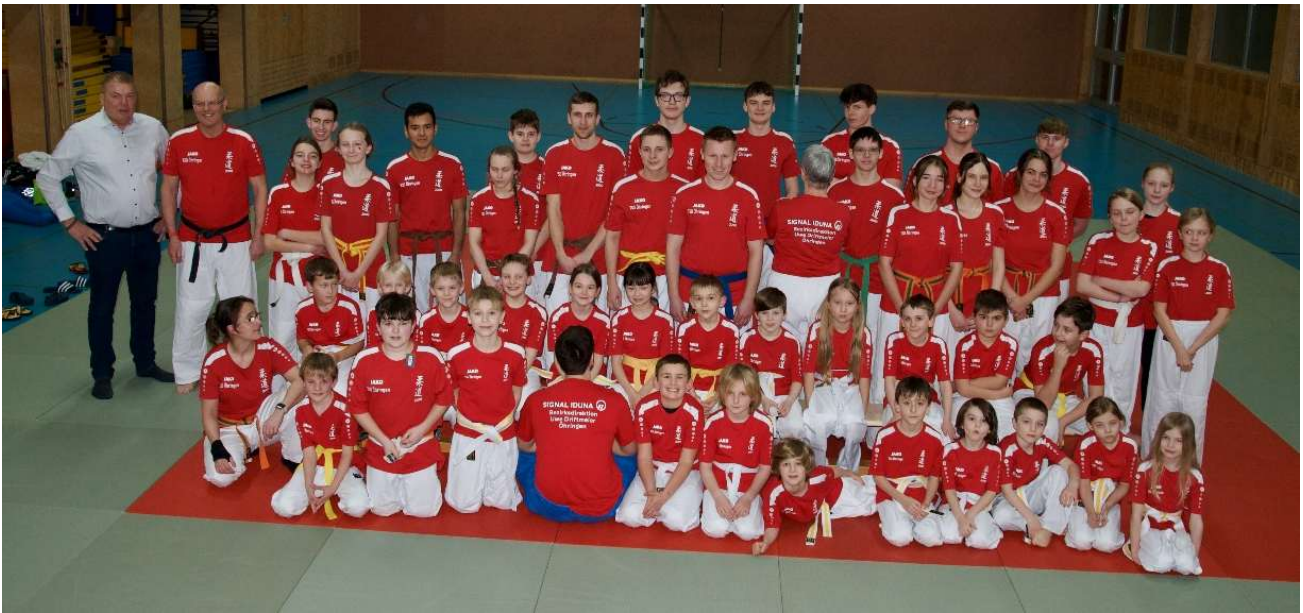
Gruppenfoto anlässlich der neuen Judo-T-Shirts (Februar 2025)

Nachdem wir im letzten Jahr viel Trubel in unserer Judoabteilung hatten, wünschten wir uns für dieses Jahr, Ruhe und Kontinuität. Nach der Renovierungsphase der Ochseneseehalle stand uns die Halle in diesem Jahr uneingeschränkt zur Verfügung und der Trainingsbetrieb konnte zuverlässig stattfinden. Die Kinder und Jugendlichen erschienen regelmäßig und pünktlich auf der Matte und so war es für uns Trainer immer ein Spaß, mit ihnen zu trainieren. In den einzelnen Gruppen gibt es stets Veränderungen. Mitglieder hören (leider) mit dem Judosport auf, neue kommen hinzu.