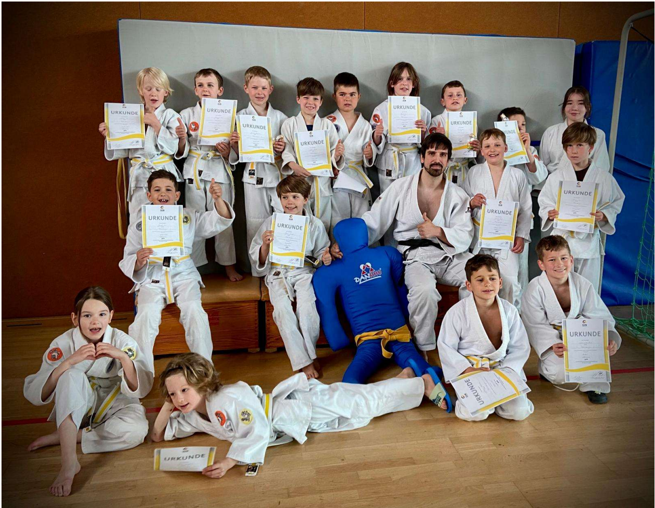
Gürtelprüfung, alle haben bestanden (April 2025)

Frage 1 wurde im letzten Jahr beantwortet. Die Ochsenhalle stand uns frisch saniert in vollem Umfang zur Verfügung.