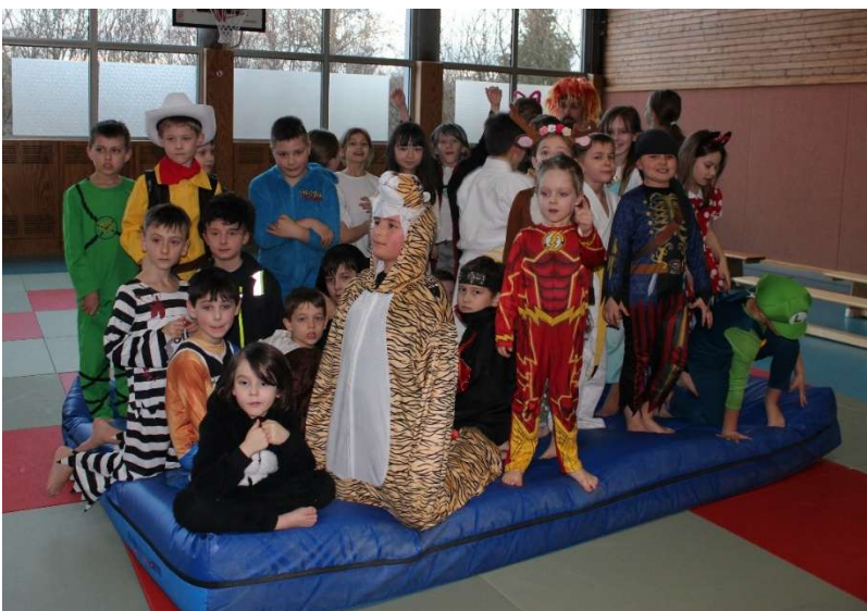
Faschingstraining (Februar 2025)

Nachdem wir im letzten Jahr viel Trubel in unserer Judoabteilung hatten, wünschten wir uns für dieses Jahr, Ruhe und Kontinuität. Nach der Renovierungsphase der Ochseneseehalle stand uns die Halle in diesem Jahr uneingeschränkt zur Verfügung und der Trainingsbetrieb konnte zuverlässig stattfinden. Die Kinder und Jugendlichen erschienen regelmäßig und pünktlich auf der Matte und so war es für uns Trainer immer ein Spaß, mit ihnen zu trainieren. In den einzelnen Gruppen gibt es stets Veränderungen. Mitglieder hören (leider) mit dem Judosport auf, neue kommen hinzu.