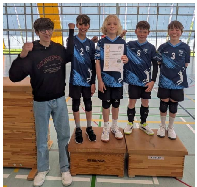
U13 männlich Mannschaft 2