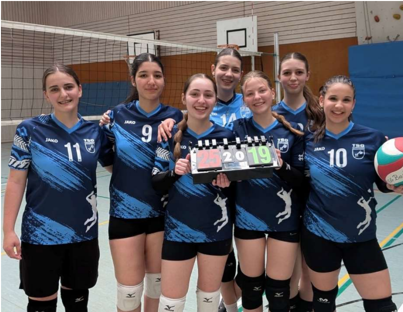
U17 weiblich Mannschaft 3